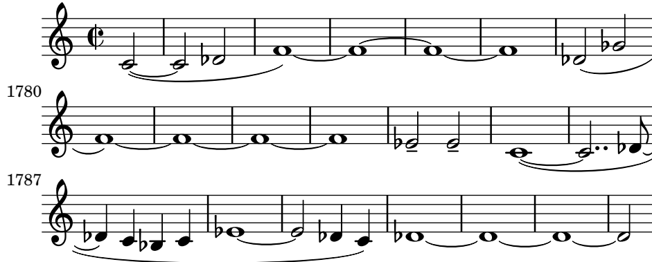
Abbildung 3: Thema Englischhorn

Dieses Finale stellt so etwas wie eine Zusammenfassung und Wiederaufnahme, eine Reprise der Symphonie dar. Gewissermaßen ein Kondensat des vorher Geschehenen. Man könnte diese Phase der Symphonie auch als versöhnlichen Rückblick auf ein ereignisreiches, erfülltes Leben interpretieren. DMITRI SCHOSTAKOWITSCH verfolgt mit seiner 15ten und letzten Symphonie einen ähnlichen optimistischen, idealistischen Ansatz: Ein Mensch tritt erhabenen Hauptes, zufrieden und mit sich selbst im Reinen, von der Bühne des Lebens ab. Auch PETERSSONS Symphonie lässt keinen Raum für Religiosität, beispielsweise einem Leben nach dem Tod. Nachdem der letzte Ton verklungen ist, sind alle offenen Fragen beantwortet, es kann Ruhe eintreten. Ein in sich geschlossenes Werk eines willensstarken, in sich gefestigten, Menschen. Konträr dazu verhält sich beispielsweise GUSTAV MAHLERS letzte vollständige Symphonie, die 9te . Hier werden mehr Fragen aufgeworfen, als beantwortet. Der Zuhörer wird am Schluss ratlos zurückgelassen.