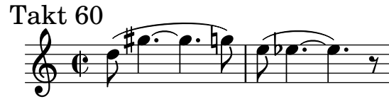
Abbildung 2: Ego- oder Geburts-Motiv

Ab Minute 4 erhebt das »Ich« erstmals seine Stimme.