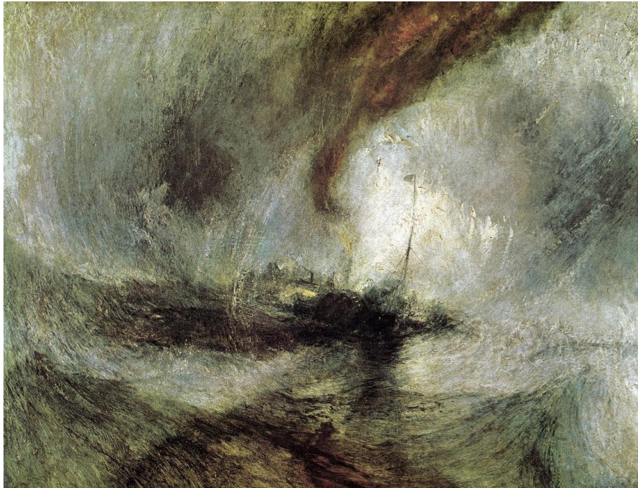
Abbildung 4: JOSEPH MALLORD WILLIAM TURNER Snow Storm - Steam Boat off a Harbor's Mouth Making Signals in Shallow Water (1842)

TURNERS Bild thematisiert in Abbildung 4 2 den Kampf des Menschen mit den Elementen.