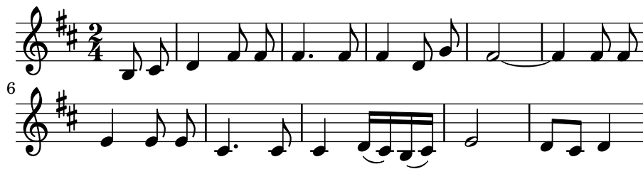
Abbildung 5: Han ska släcka min lykta

TURNERS Bild thematisiert in Abbildung 4 2 den Kampf des Menschen mit den Elementen.